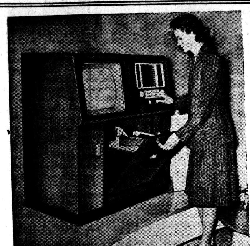
Pesawat Telewisi radio dan gramofon listrik keluaran pabrik His Master's Voice. jang paling belakang.

Bangkok: Kantor2 kawasan dari UNICEF (Fonds Darurat Anak2 Internasional) akan dipindahkan dari Manila ke Bangkok pada akhir bulan April, demikian diumumkan di hari Rebo.